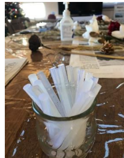
輪っかができたら、グルーガンで接着です!!