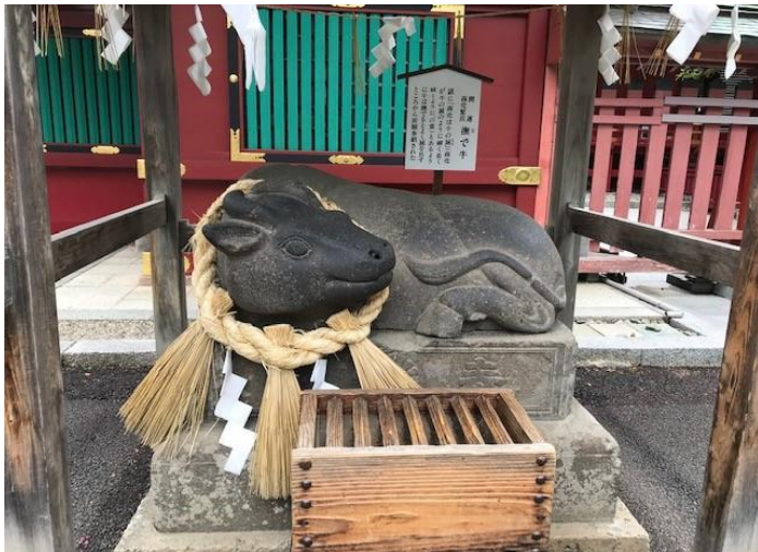
宮城県 塩釜神社の撫牛

撫牛(撫で牛、なでうし)とは、ウシ(牛)の座像の置物を撫でて自分の病気を治す信仰習俗