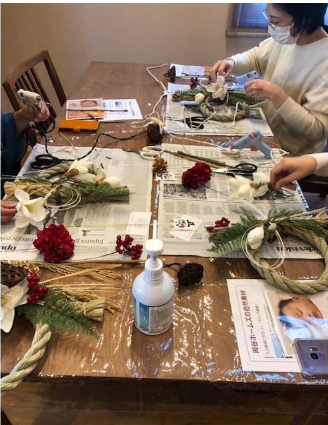
いよいよ完成です!!