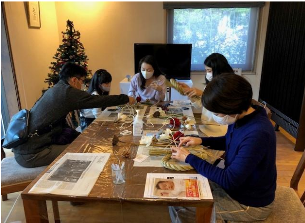
材料のお花・稲穂などを取り付けます!!