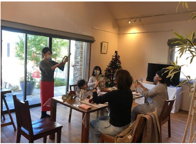
縄を輪っかにして、ワイヤーで固定します。